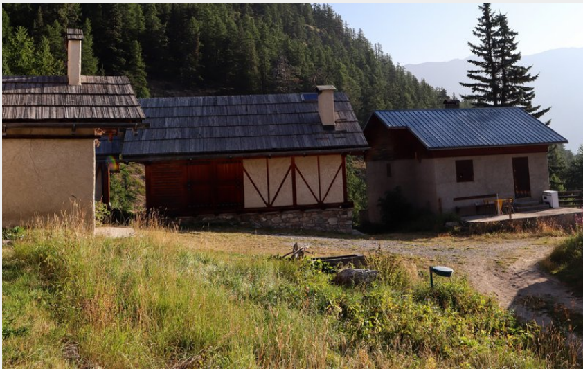
Chalets du Granon