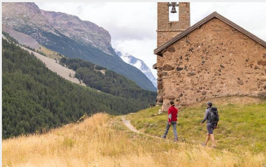
Chapelle Saint-Antoine