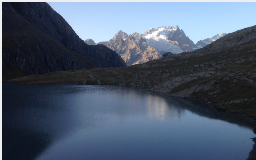
Lac du Goléon au petit matin