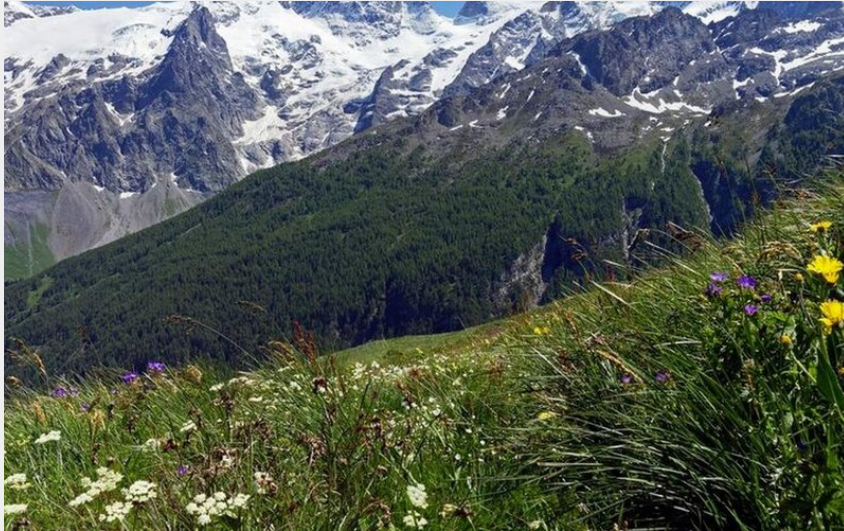
La Meije depuis le sentier de Clos Raffin au Chazelet