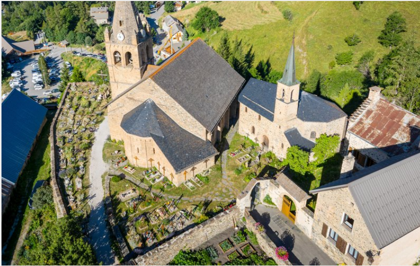
La Grave village