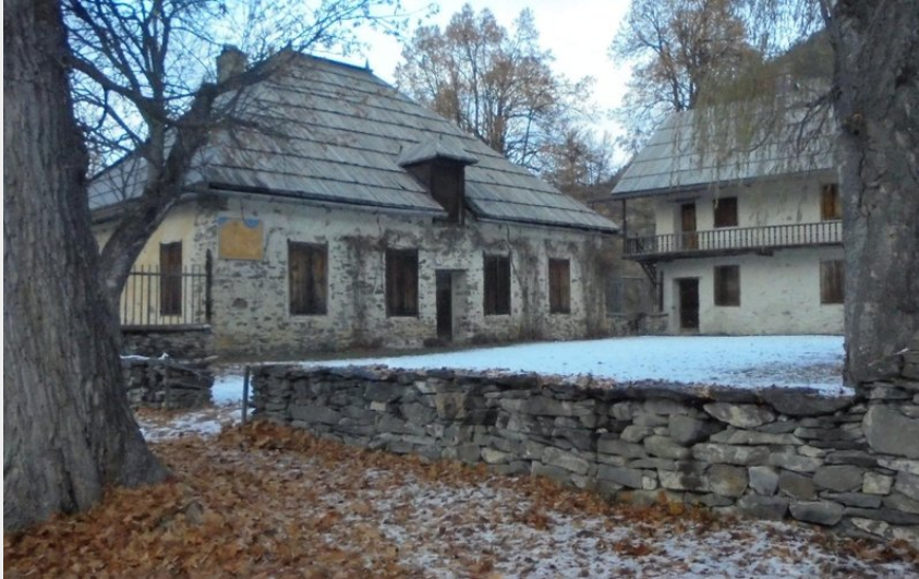
Clairière du Lauzin