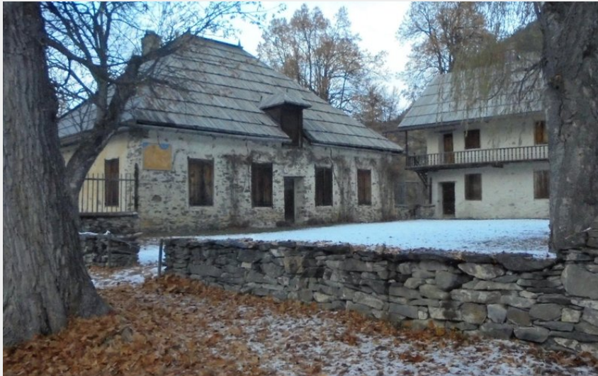
Clairière du Lauzin