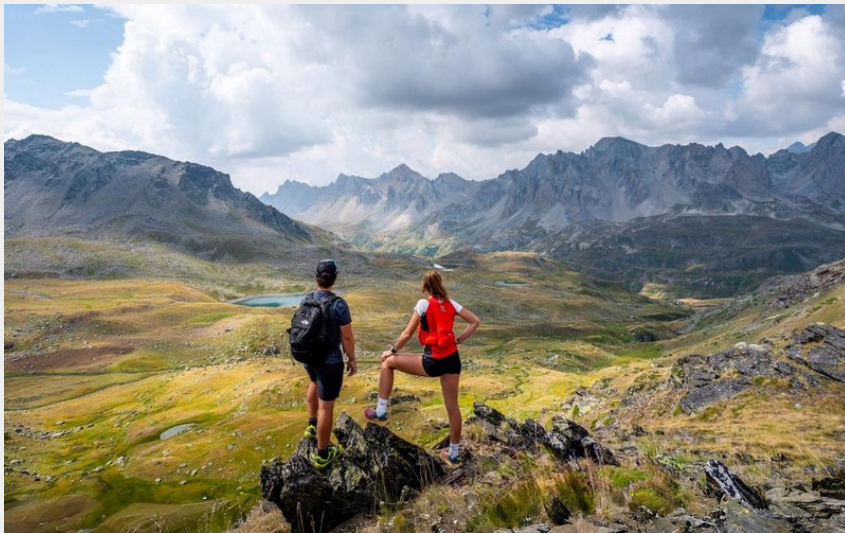
Rando Col des Muandes