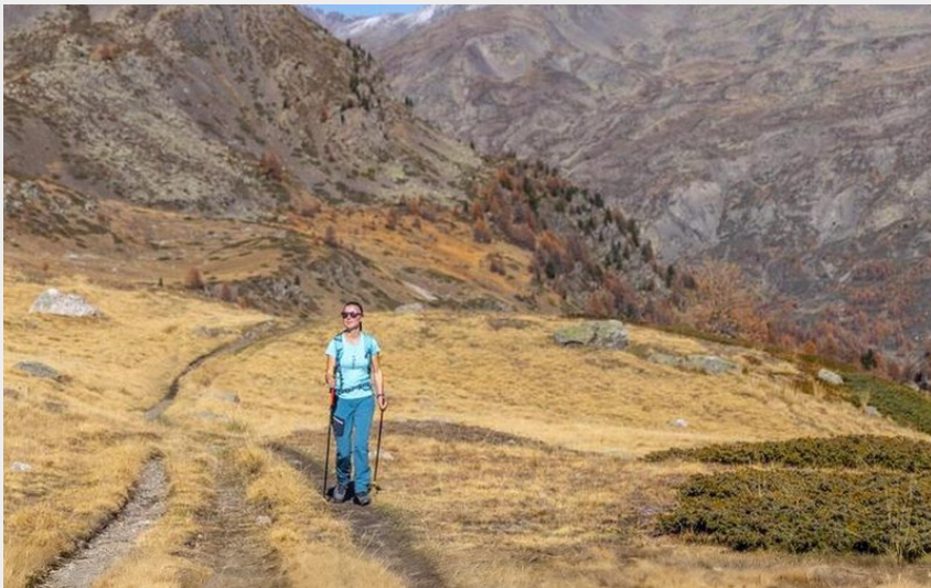
Montée au Col de Buffère