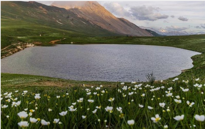
Col des Thures et lac Chavillon