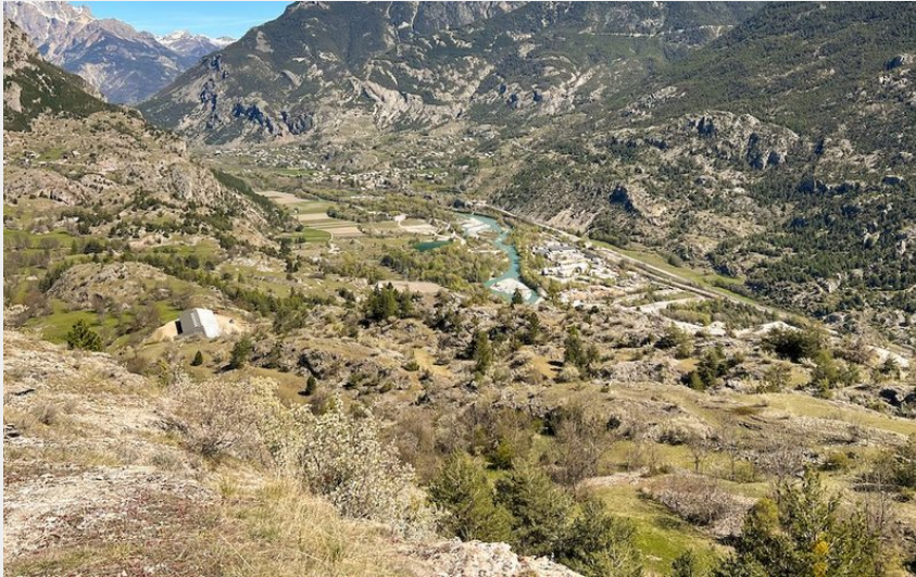
Panorama sur la vallée de la Durance (Pays des Écrins - Pierre Nossereau)