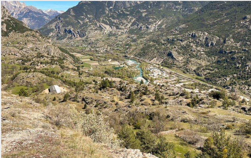
Panorama sur la vallée de la Durance