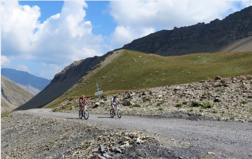
Encore quelques mètres (© Serre-Ponçon)