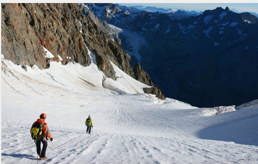
Descente sur le glacier du Pelvoux et des Violettes (Rogier Van Rijn)