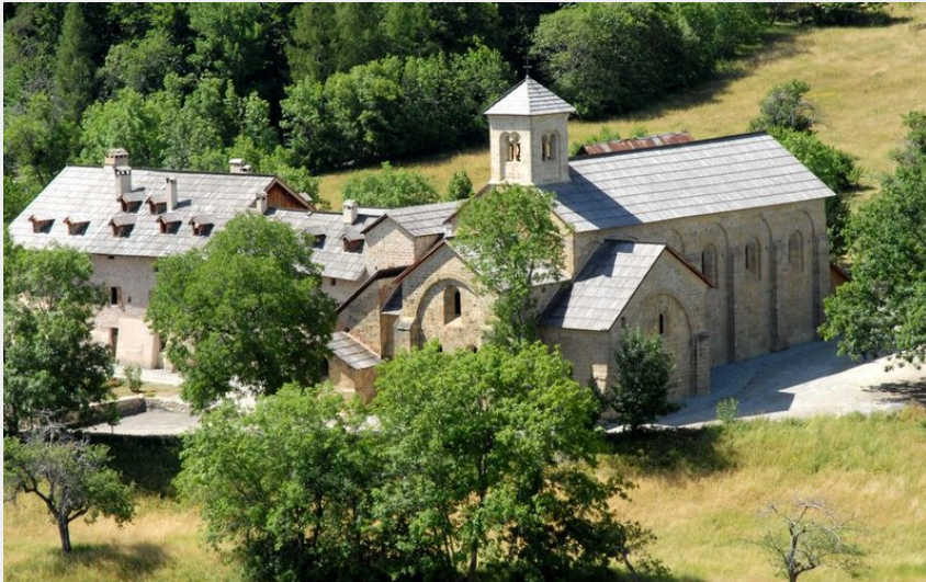
Abbaye de Boscodon (AAAB)