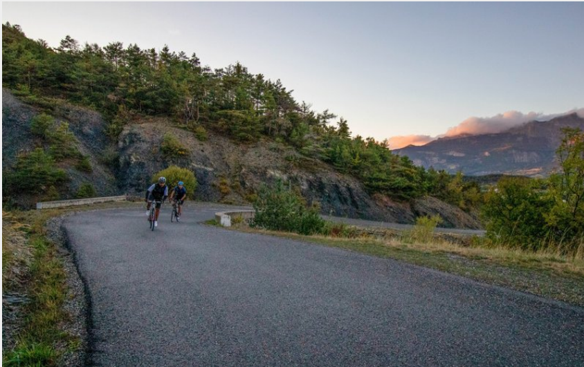
Ascension du col Lebraut (Clémence DEBENATH)