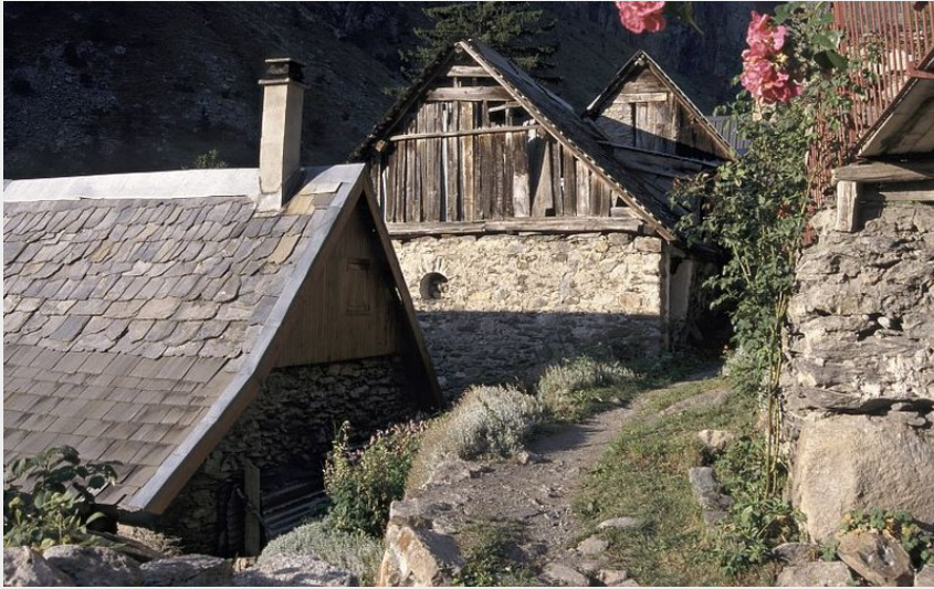
village de Lanchâtra (Roche Daniel)