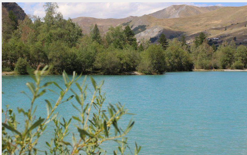
Les hameaux de Villar depuis la Gravière (M. Molinari)