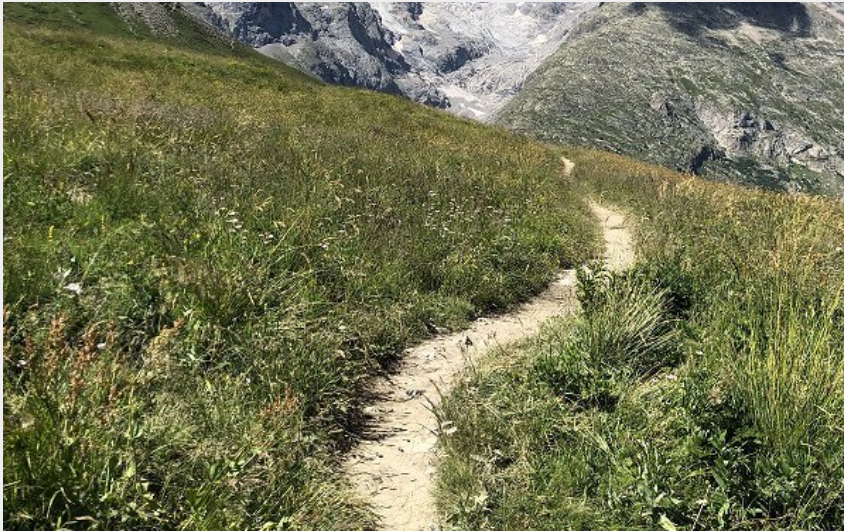
Le Glacier de l'homme (M.Molinari)