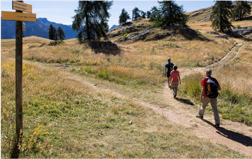
Vers le belvédère des Têtes