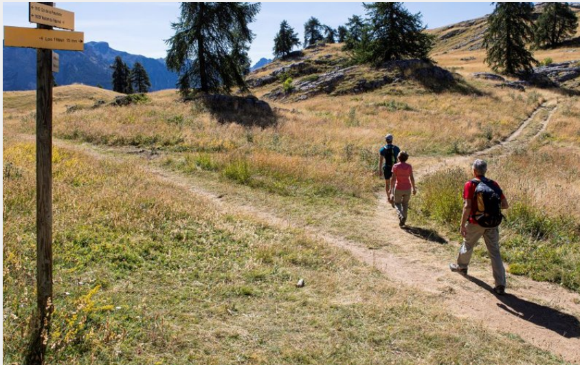
Vers le belvédère des Têtes