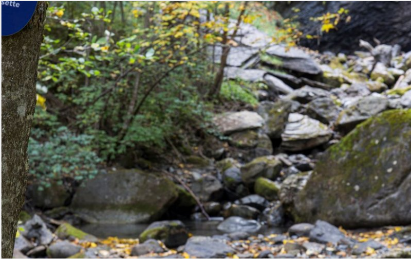
Cascade de la Pissette à l'automne