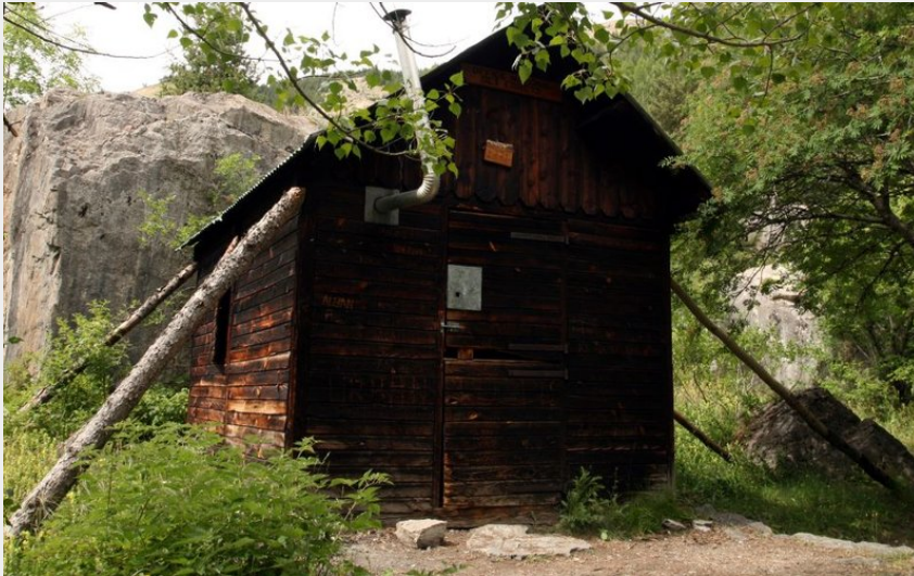
La cabane de Chouvet (Marie-Geneviève Nicolas - Parc national des Ecrins)