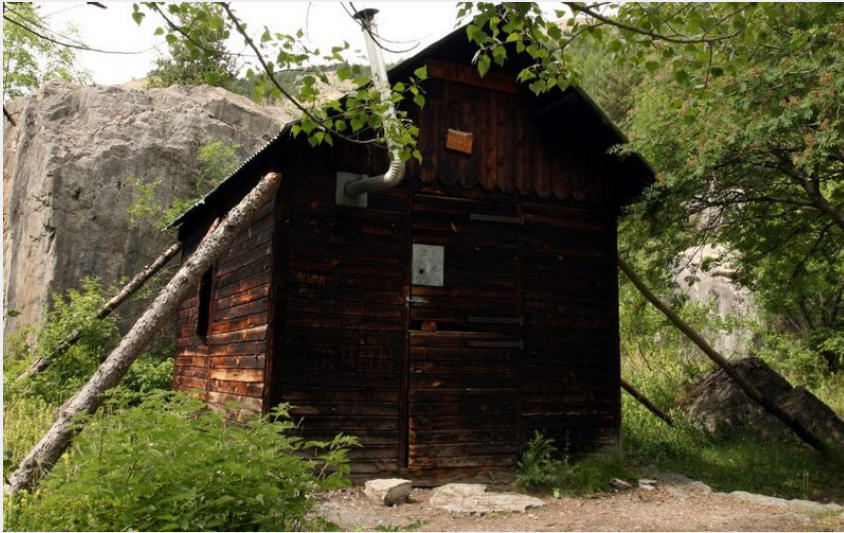
La cabane de Chouvet