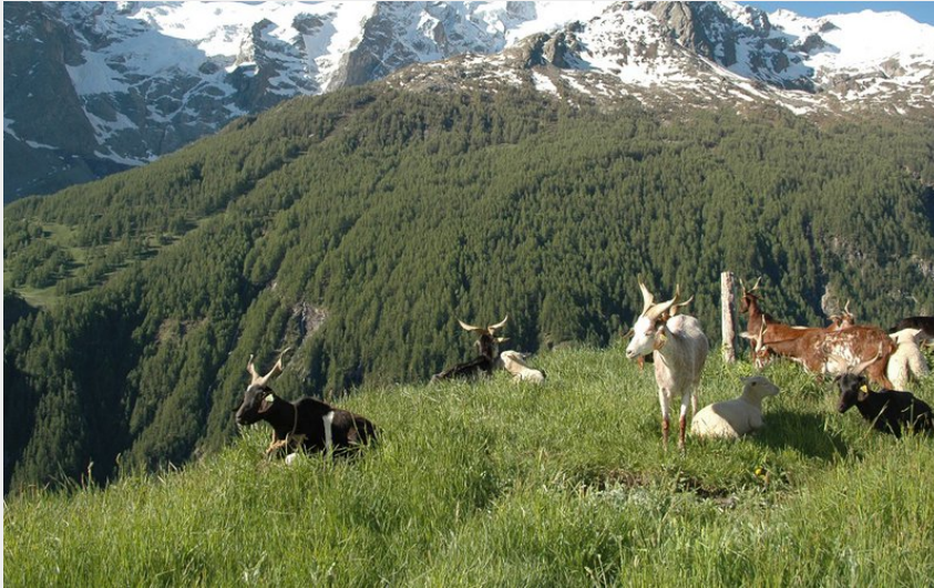
Troupeau face à la Meije