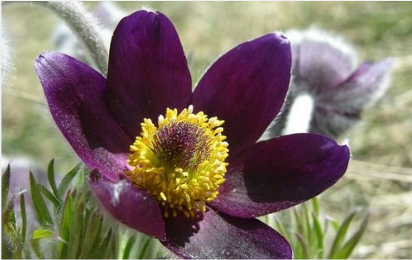
Pulsatille de montagne (Thierry Maillot - PNE)