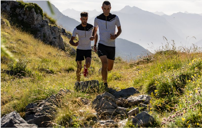
Trail Réallon