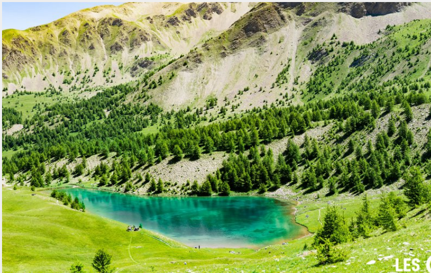
Lac Sainte Marguerite (Willy Camus)