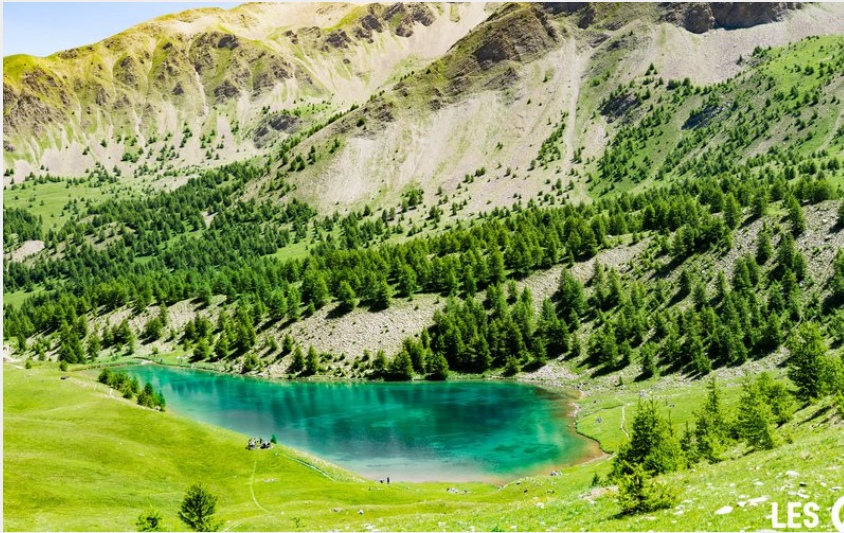
Lac Sainte Marguerite (Willy Camus)