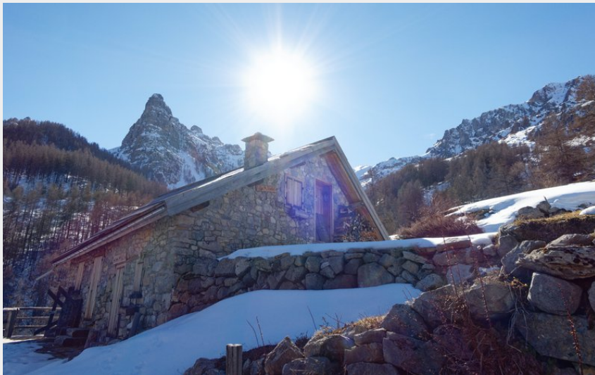
Chalet de Vaucluse (Lucien Mariotte)