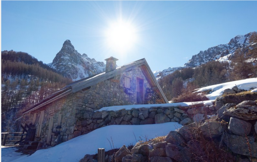
Chalet de Vaucluse (Lucien Mariotte)