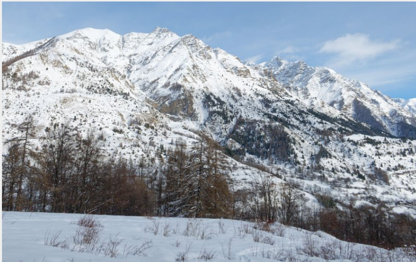
Tête de l'Eslucis (Lucien Mariotte)