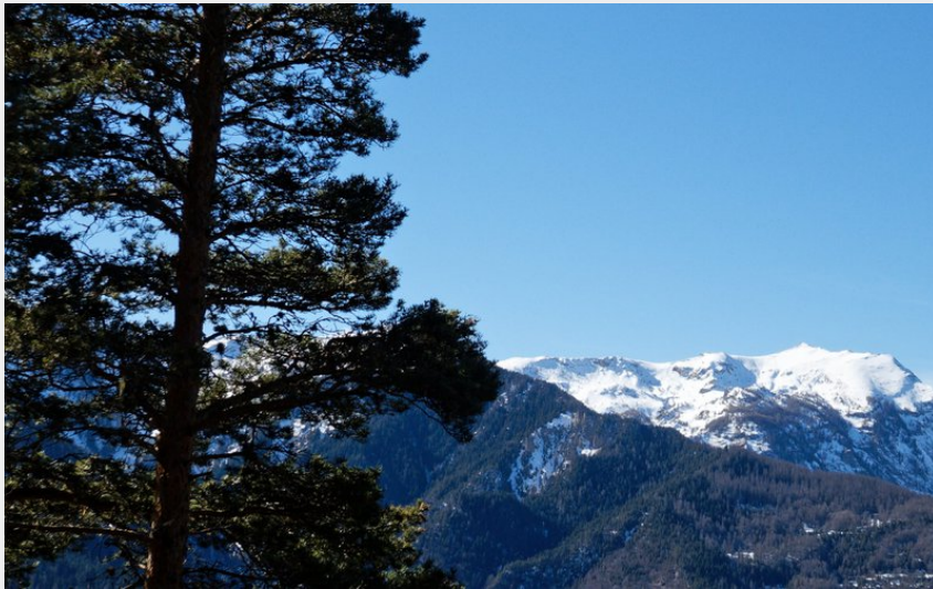
Sommet du Morgon (Lucien Mariotte)