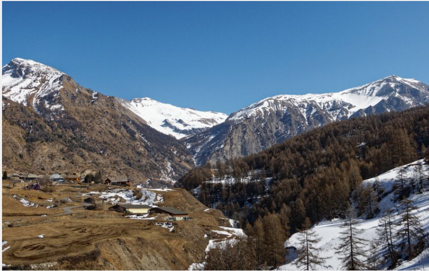
Hameau de la Chalp (Lucien Mariotte)