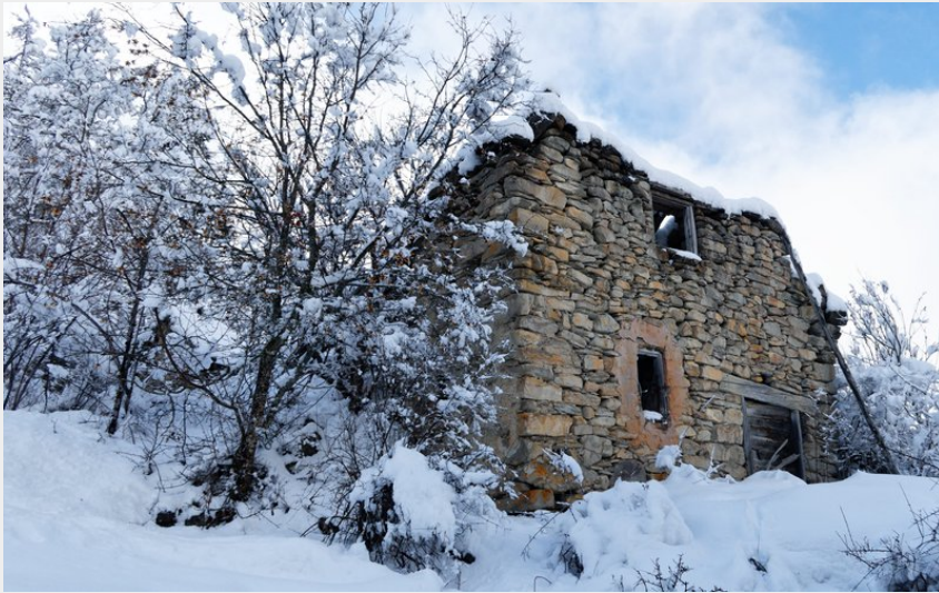
Ruine de la Muande (Lucien Mariotte)