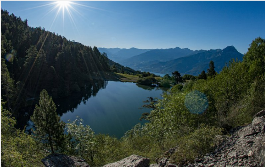
Lac St-Apollinaire