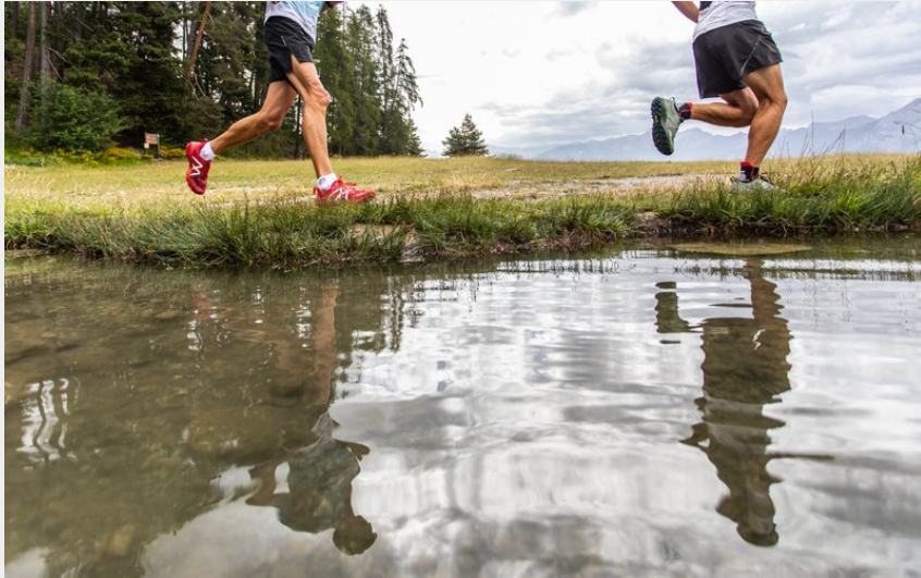
Lac de Saint Apollinaire