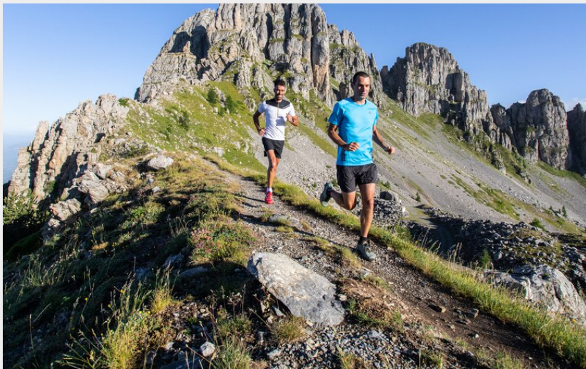
Sous les aiguilles de Chabrières