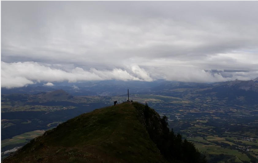
Le Palastre (A. Foll - CDRP)