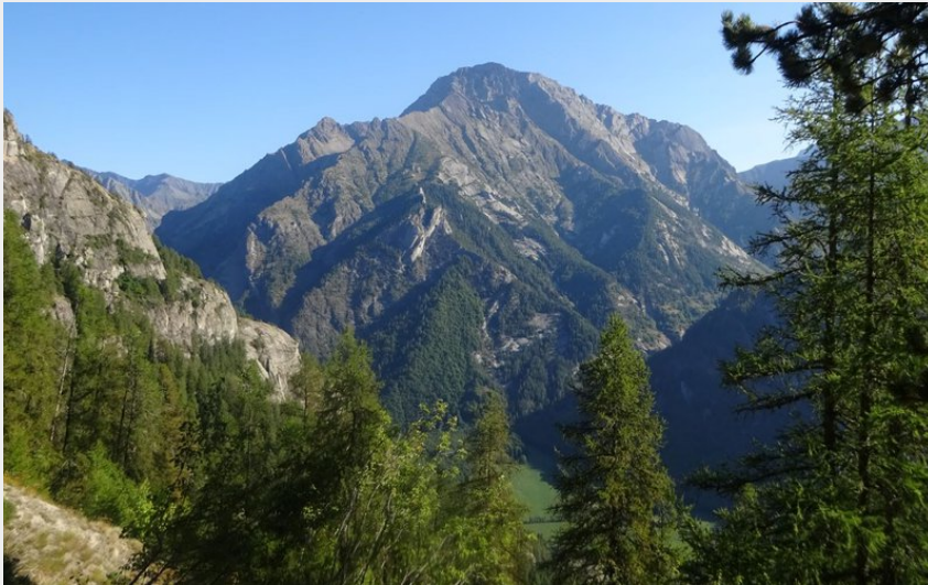
L'aiguille de Cédéra depuis le sentier