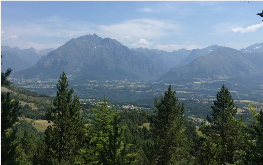
Vue depuis le sentier Dominique-Villars