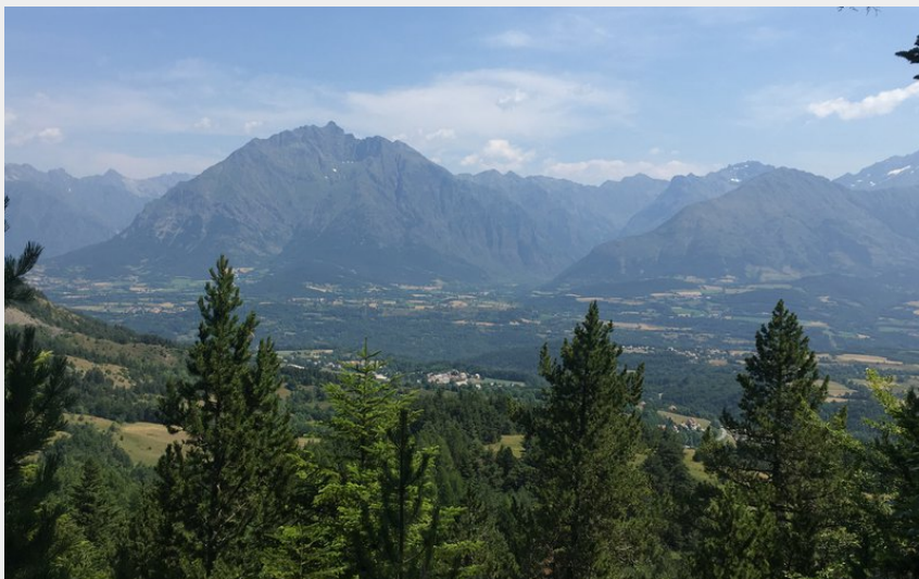
Vue depuis le sentier Dominique-Villars (M. Berger - CDRP)