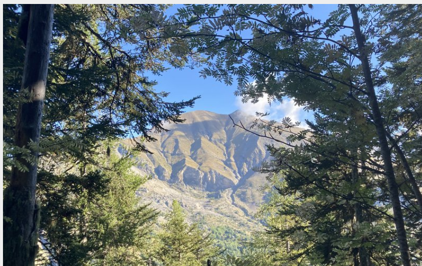
Sur le sentier (M. Bataut - CDRP)