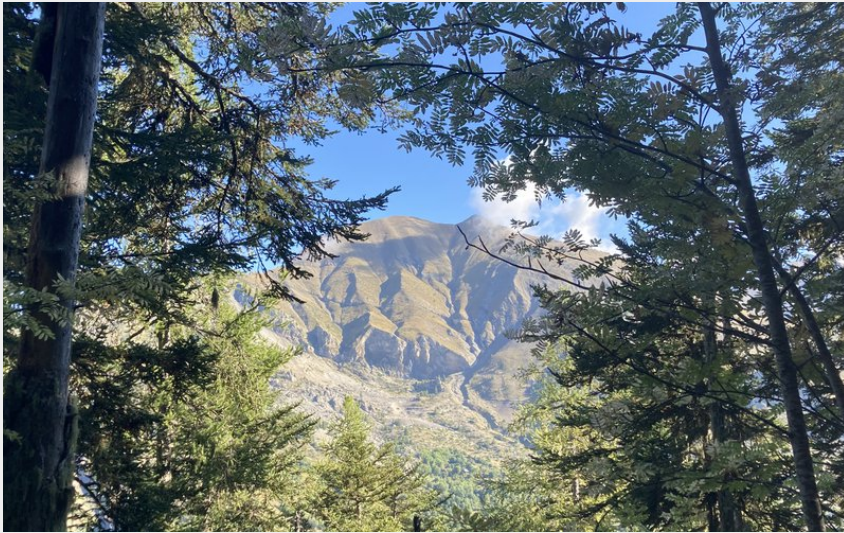
Sur le sentier