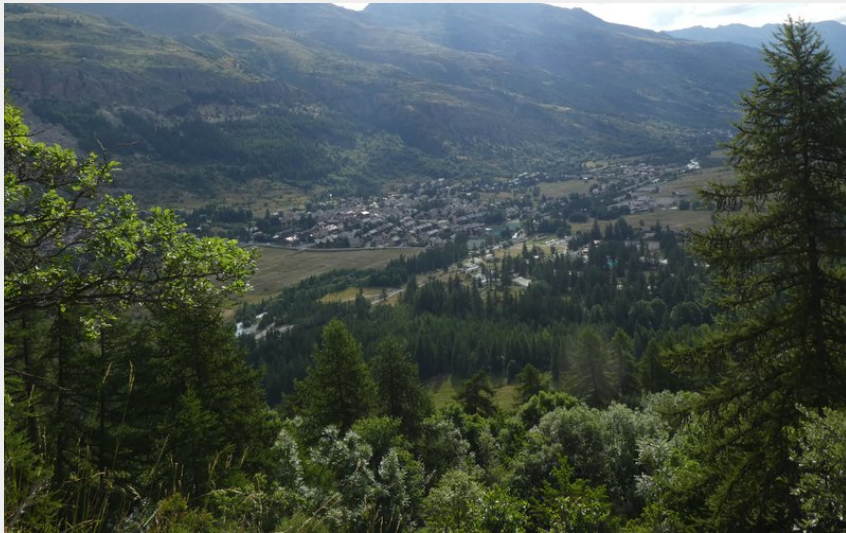
Vers le Grand Aréa (J.C. Belleteste - CDRP)