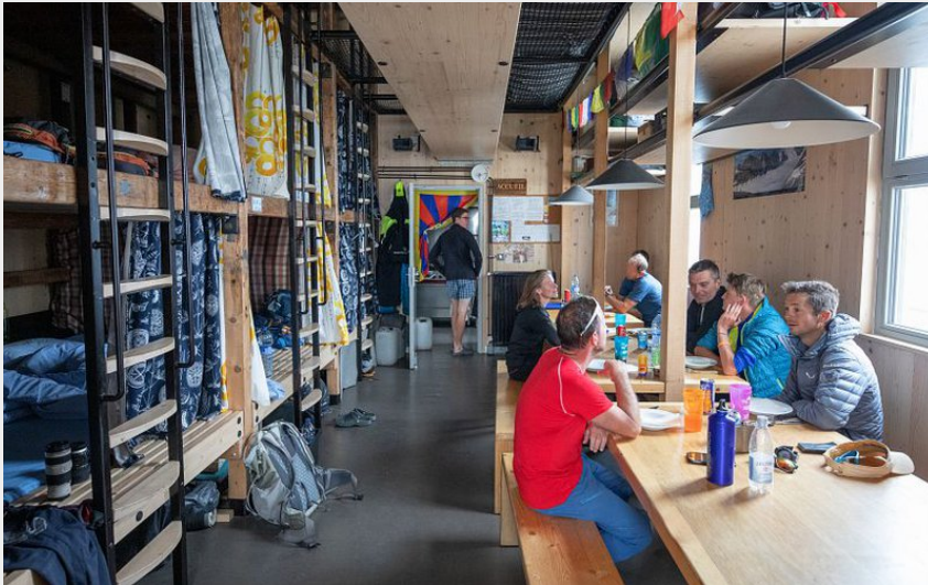
Refuge de l'Aigle