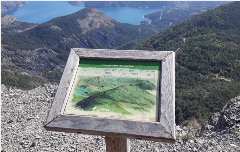
Vue sur le lac de Serre-Ponçon