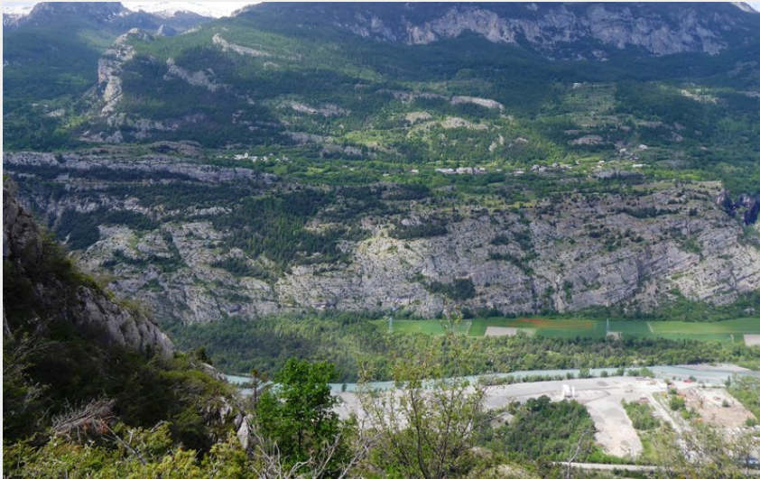
Point de vue sur les Ecrins