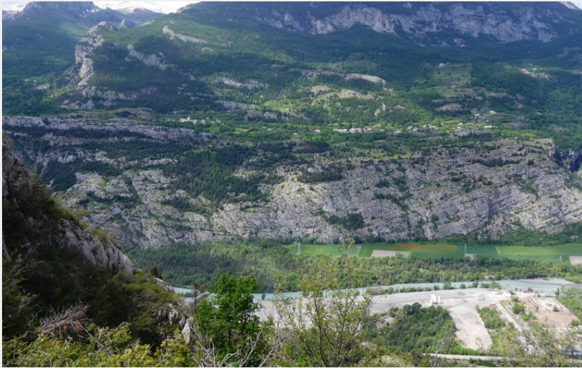
Point de vue sur les Ecrins