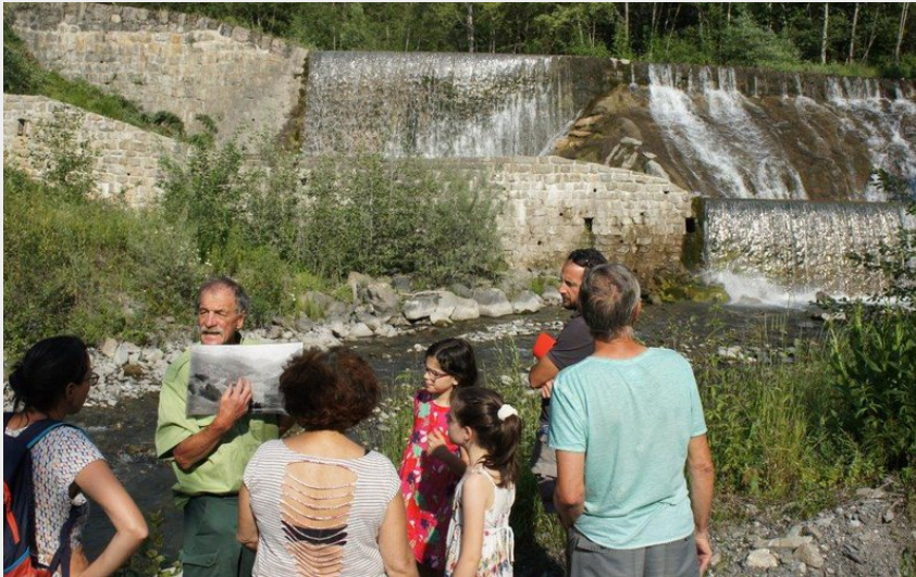
Parcours sens'action Les milles cascades (Pays d'Art et d'Histoire)