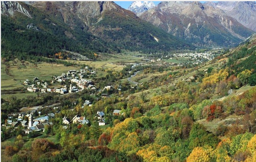
Les Guibertes