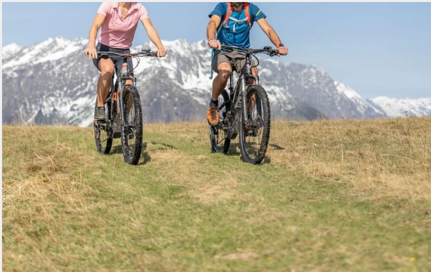
Col d'Hurtières